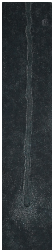
雫 麻布・岩絵具 2014