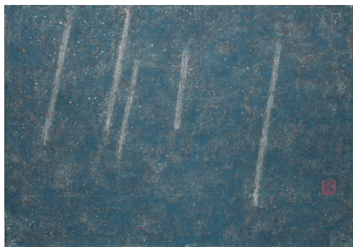
ときあめ 麻布・岩絵具 2014