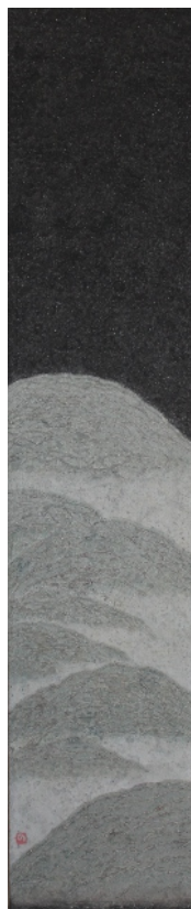
境 麻布・岩絵具 2014