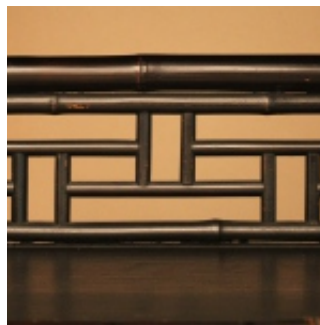
李朝 竹張 飾棚 部分